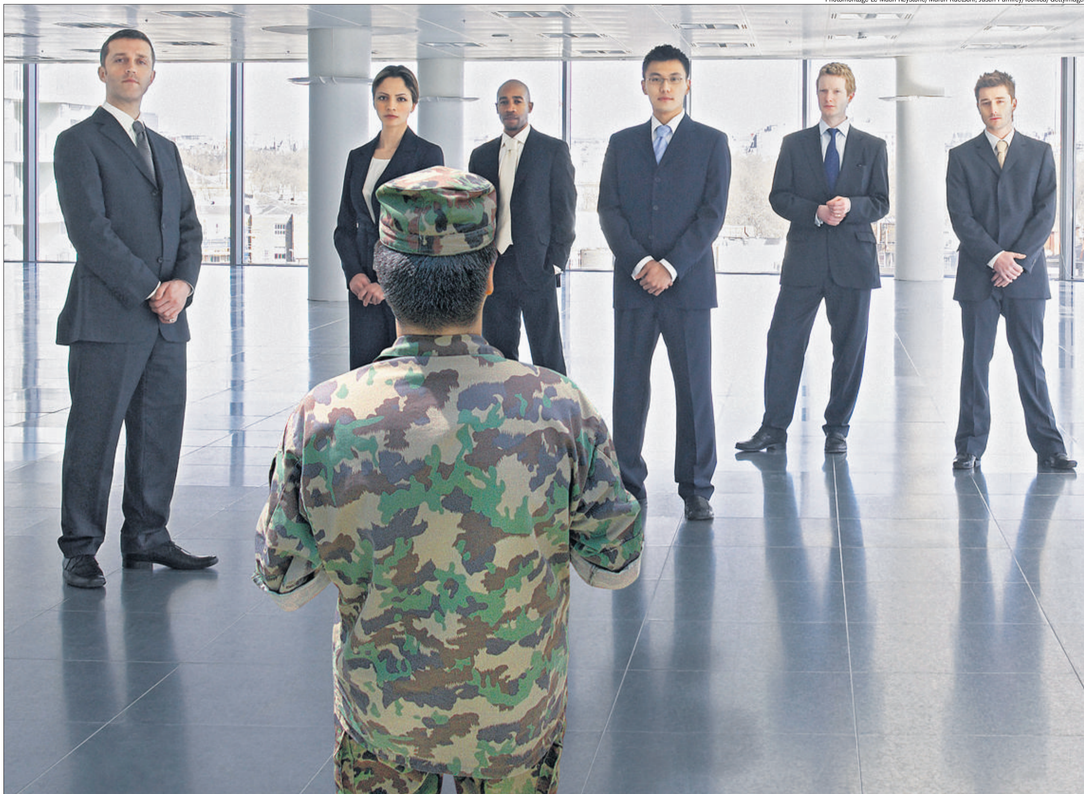
Les compétences en leadership et management acquises par les officiers sont encore insuffisamment reconnues dans la vie professionnelle. Le diplôme délivré par l'Association suisse des cadres (ASC) entend corriger ce déséquilibre.

TRAVAIL. L'Association suisse des cadres propose un diplôme destiné à valider les acquis des officiers dans la vie professionnelle. Un papier civil déjà très demandé, qui démontre que les passerelles entre armée